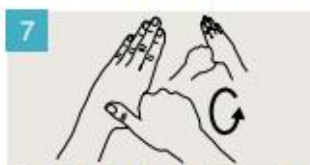
Rodeando el pulgar izquierdo con la palma de la mano derecha, fróteselo con un movimiento de rotación, y viceversa.