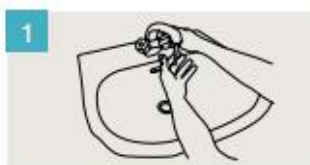
Mójese las manos.

DURACIÓN DEL LAVADO: entre 40/60 segundos