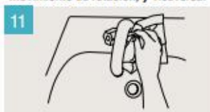
Utilice la toalla para cerrar el grifo.