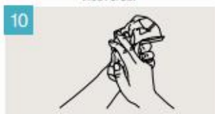
Séquese las manos con una toalla de un solo uso.