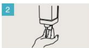
Aplique suficiente jabón para cubrir todas las superficies de las manos.