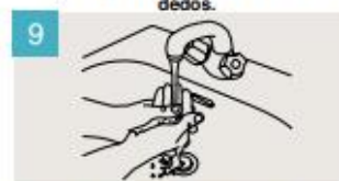
Enjuáguese las manos.