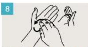
Frótese la punta de los dedos de la mano derecha contra la palma de la mano izquierda, haciendo un movimiento de rotación, y viceversa.