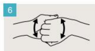
Frótese el dorso de los dedos de una mano contra la palma de la mano opuesta, manteniendo unidos los dedos.